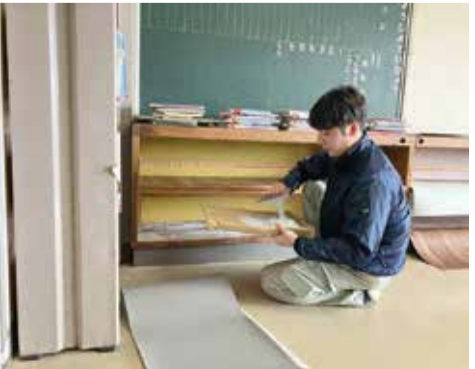
山口組合 青年部によるボランティア活動 周南市今宿小学校 新1年生のランドセルロッカーの修繕