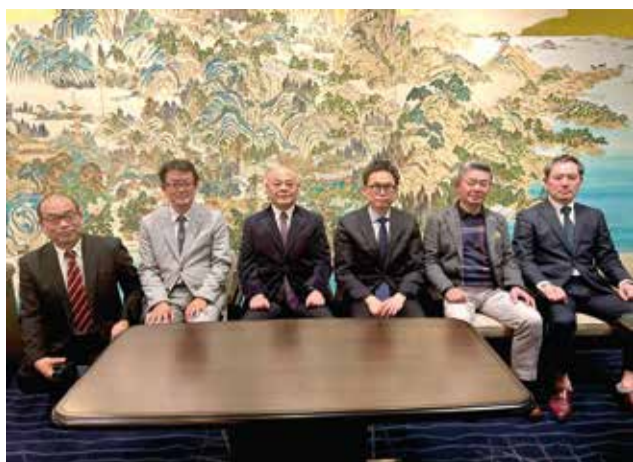
中国ブロックの皆さん

「中国ブロックの会長を務めて約2年になります。組合内部の問題点はもとより、内装業界全体の課題も共有できるなど理事長同士の交流は深まっています。 「中国ブロックの会