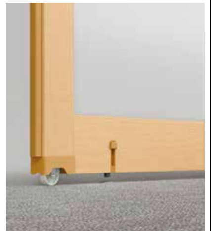
プレイス「下荷重仕様」

立川ブラインド工業は、ヨコ型ブラインド「シルキー」に新たに「ハンドル操作」を追加、また間仕切「プレイス」に新仕様として「下荷重仕様」を追加する。 シルキーに加わる「ハンドル操作」は、操作コードがなく、すっきりとした意匠性のため、片手でも扱いやすく、直感的に操作できる。また少ない動作でスムーズに開閉でき、点も特徴である。小