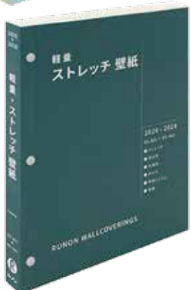
ルノンストレッチ壁紙

ルノンは、ビニル壁紙見本帳「ルノンマークII Vol.26」を発刊した。 同見本帳は、「心地よさを、アップグレード」をテーマに、これまでの暮らしをさらに