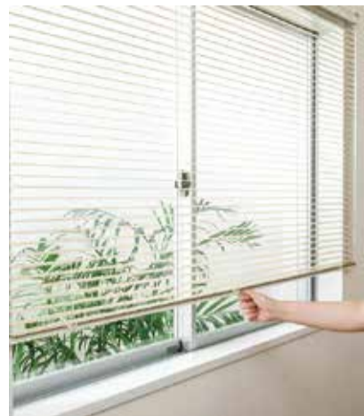
シルキー「ハンドル操作」

立川ブラインド工業は、ヨコ型ブラインド「シルキー」に新たに「ハンドル操作」を追加、また間仕切「プレイス」に新仕様として「下荷重仕様」を追加する。 シルキーに加わる「ハンドル操作」は、操作コードがなく、すっきりとした意匠性のため、片手でも扱いやすく、直感的に操作できる。また少ない動作でスムーズに開閉でき、点も特徴である。小