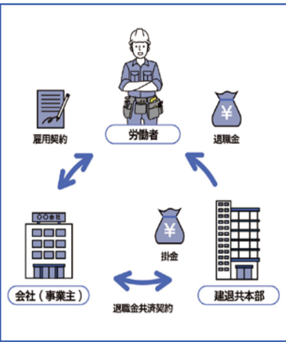
建退共制度の全体像

建設技能者は、一つの会社で長く勤めるよりも、その現場が終わると次の現場に移動したり、短期間で勤務先が変わったりするケースも多く、個々の会社で退職金を管理することが難しい。その課題