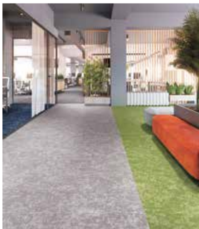
シャイニーミスト

立川ブラインド工業は、全国15会場にて「タチカワブラインド」で満たされる心と暮らしをテーマに「タチカワブラインド新製品発表会2025」を開催する。新製品の展示をはじめ、ウェルビーイングをキーワードに心と身体の健康に着目した4つのライフスタイルの提案や電動製品の体感などができる。