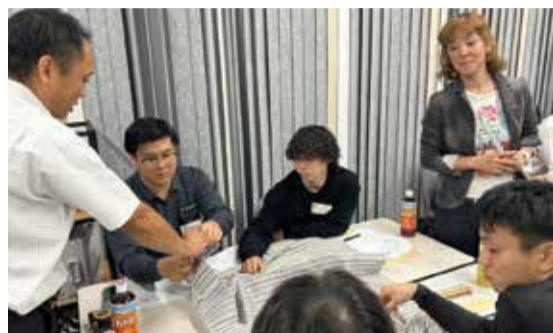
「若手研修会」参加者