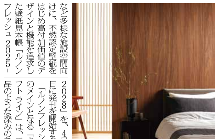
新シリーズ「アルフェイス」

ルノンは、ホテルやオフィス、医療・福祉などに差し込むだけでなく、使用可能で、「電源分岐ジョイント」仕様なら最大10台を接続できる。またバッテリー仕様はコンセントがなくても電動化が可能で、1回の満充電(約3時間)で約3カ月使用できる。さらに専用アプリを使用すれば、ホームタコスを含む対応家電・設備を一括管理でき、外出先からの遠隔操作も可能となる。