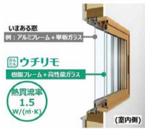
最小47ミリで設置可能

YKK APは、最小47ミリあれば設置可能な樹脂製内窓「かんたんウチリモ 内窓」引違い窓を、7月7日に新発売する。現在、「先進的窓リノベ事業」の実施により同社の「マドリモ内窓 プラマードU」の販売数量は、2022年度と比べ約2.5倍と大きく拡大している。その一方で、築年数が古い木造住宅など