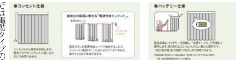
「ホームタコス エアレ」の2つの電動仕様

では電動タイプの「ホームタコス エアレ」が新登場した。「コンセント仕様」と「バッテリー仕様」の2種類から選べることで、コンセント仕様は電源プラグをコンセン