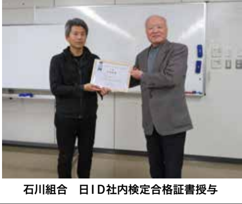
石川組合 日ID社内検定合格証書授与