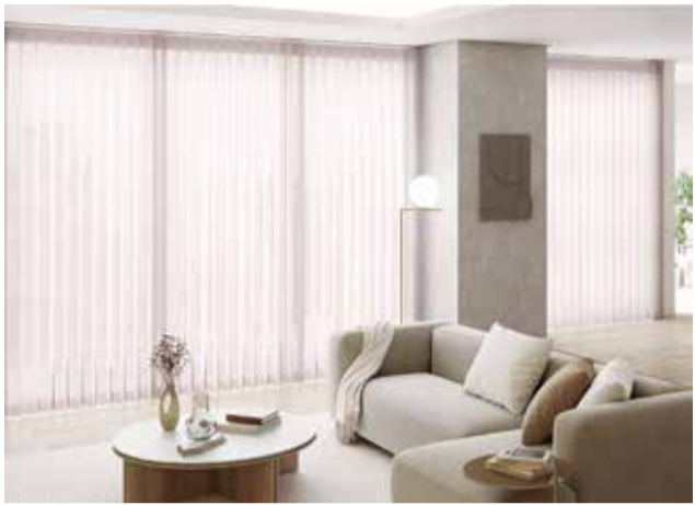
調光タテ型ブラインド「エアレ」

立川ブラインド工業は、調光タテ型ブラインド「エアレ」をリニューアル、電動タイプ「ホームタコス エアレ」をラインナップするなど5月1日に新