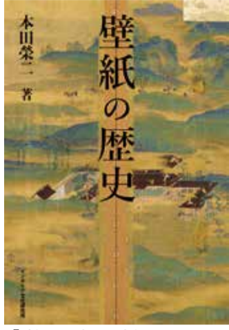
『壁紙の歴史』の表紙

境問題』だ。しかし後者は発売部数が200部限定なので致し方ない。筆者は以前からライフワークを「インテリア環境問題」と「比較インテリア史」の2テーマに絞ってきたが、インテリア文化研究所(ICI)設立後は「温故知新」の観点から「比較インテリア史」に力点を置いてい