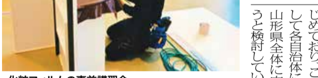
化粧フィルムの事前講習会