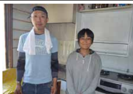
なかがよしどろんどろんクラブ

はなかった。そこで同組合は、子どもたちに楽しく遊べる快適な環境を提供すべく、「なかよしどろんどろんクラブ」「山の手みなみクラブ児童育成会」「学童保育所えぞりすクラブ」の3カ所の児童施設の内装リフォームを行った。 それぞれの施設からの要望に応え、「なかよしどろんどろんクラブ」には台