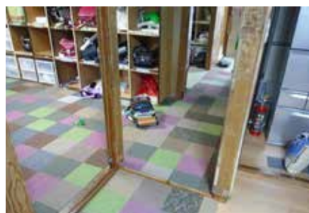
山の手みなみクラブ児童育成会