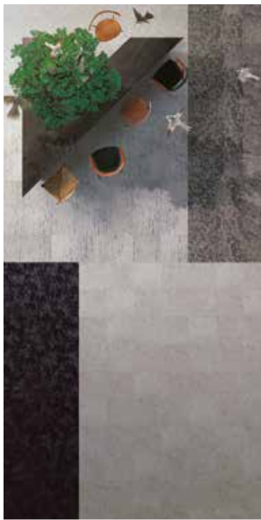
カーペットタイル「DT」

サンゲツは、「プレミアム&ベーシック」をテーマに、オフィスからホームまで幅広いニーズに対応するタイルカーペットシリーズ「DT」、「NT」をこのほど発売した。プレミアムなデザインをラインナップする「DT」では、「森に包まれる心地よさ」を表現した「Voice Collection」、日本の伝統柄をベースに風情をモチーフとした「Japanisme」などトレンドを捉えた8つのカテゴリーで展開する。それぞれコンセプトの説明文とイメージ素材の写真を充実に、デザインを追求した他、エコマーク認定品「NT-250eco」に加え、原着ナイロン商品かつバックング材にリサイクル素材を使用した「NT-3000eco/3100eco」他環境対応を強化、さらにメンテナンス性とキャスト走行性・防汚性に優れた「フロテック」には、コンクリートや木目を表現したデザインを収録、機能商品のデザイン性を高めた。収録商品は56柄360点。