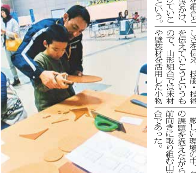
ものづくりフェスタへ参加

具体的には、一物件にかける工事費を200〜250万円を上限として、その費用を3〜4年かけて回収する。初期投資は大きくリスクもあるが、その分利幅は大きいという。一方物件のオーナー側も、しばらく家賃収入はないが、もともと長期的に空室状態が続いてきた物件である。何より物件自体の価値は高まっているためオーナーにとってメリットは大きい。