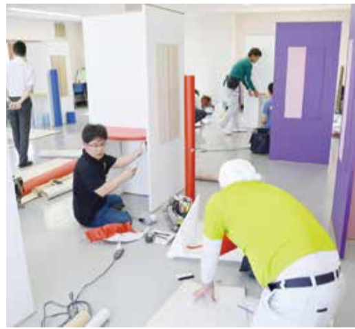
ワークステーション三多摩

平成30年度前期技能検定(所管・厚生労働省)において、はじめて「内装仕上げ施工・化粧フィルム工事作業」(1級・2級)が、全国33都道府県で実施された。日装連の提案によって実現した同技能検定。今号ではその初年度の各組合の実施状況、取り組み内容についてレポートする。