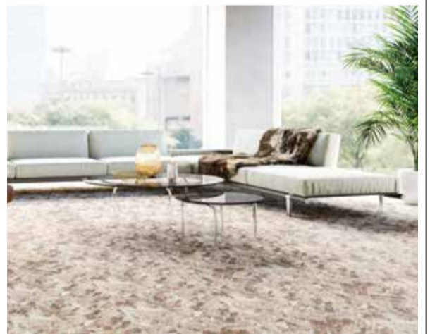
「MODE STYLE」の新柄「シャンハイプリーツ」

川島織物セルコンは、このほど多様化するオフィスニーズに対応し、タイルカーペット「MODE STYLE」、「ART BANK」、「COLOR BANK」の新柄を発売した。