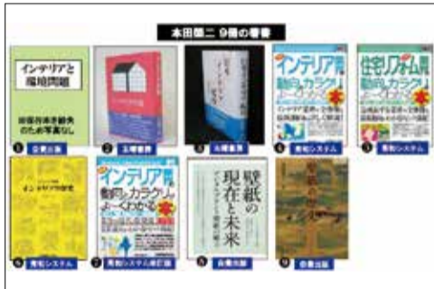
出版した九冊の書籍

インテリア文化研究所の唯一の存在だが、人間の常として得手不得手があり、苦手なのはデザイン要素の強いカーテン、得意なのは壁紙である。そこで壁紙を歴史的に考察したいと考え、『壁紙の歴史』の発刊を思い立った次第である。壁紙の特長の第一は、面積的にもインテリア商