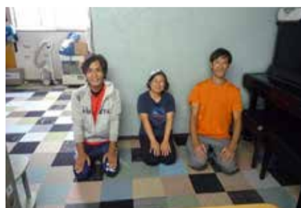
学童保育所えぞりすクラブ

所にキッチンパネルを施工、「山の手みなみクラブ児童育成会」にはタイルカーペット他床工事、「学童保育所えぞりすクラブ」には床材工事と壁面補修などを行った。 工事では、メーカー協賛品や在庫品を活用して行われ、例えばタイルカーペットは色違いの在庫品をうまく活用するため、250角にカットしパッチワークのように張り合わせるなど工夫が施された。厳しい冬を控えて床が暖かくなり、子どもたちも大喜びだった。 大縄理事長は、「ボランティアは創立30周年事業以来でしたが、活動を通じて組合員同士の絆も深まりました。今後は他の支部でも企画していきます」とのことだった。