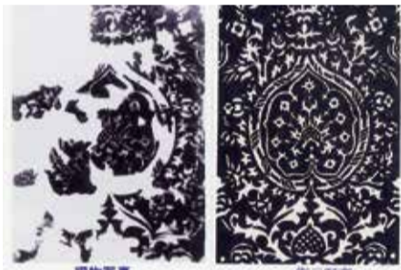
ケンブリッジフラグメント

史を記述した本はすべて「欧州中心史観」で書かれているため、日本の壁紙はほとんど紹介されていない。具体例が「現存する世界最古の壁紙はケンブリッジフラグメント」という学説である。ケンブリッジフラグメントとは1509年に製作された壁紙で、20世紀初頭にケンブリッジ大学ライストカレッジ学長宿舎改装の際、2階寝室の天井から発見されたこと