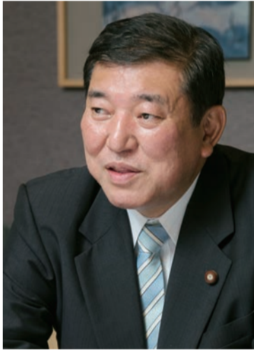
五十周年記念式典の目玉企画となるのが特別講演会。その講師をお願いするのは石破茂衆議院議員である。石破茂衆議院議員といえは、次期総理にも精通している。特別講演会では、次期総理大臣候補として日本の未来像をはじめ、建設業界の将来像などが多角的に語られるだろう。

全国理事長会懇親会にも出席し祝辞をいただき、また長時間滞在していたり、建設業界の認知度も高く、建設業界にも精通している。特別講演会では、次期総理大臣候補として日本の未来像をはじめ、建設業界の将来像などが多角的に語られるだろう。