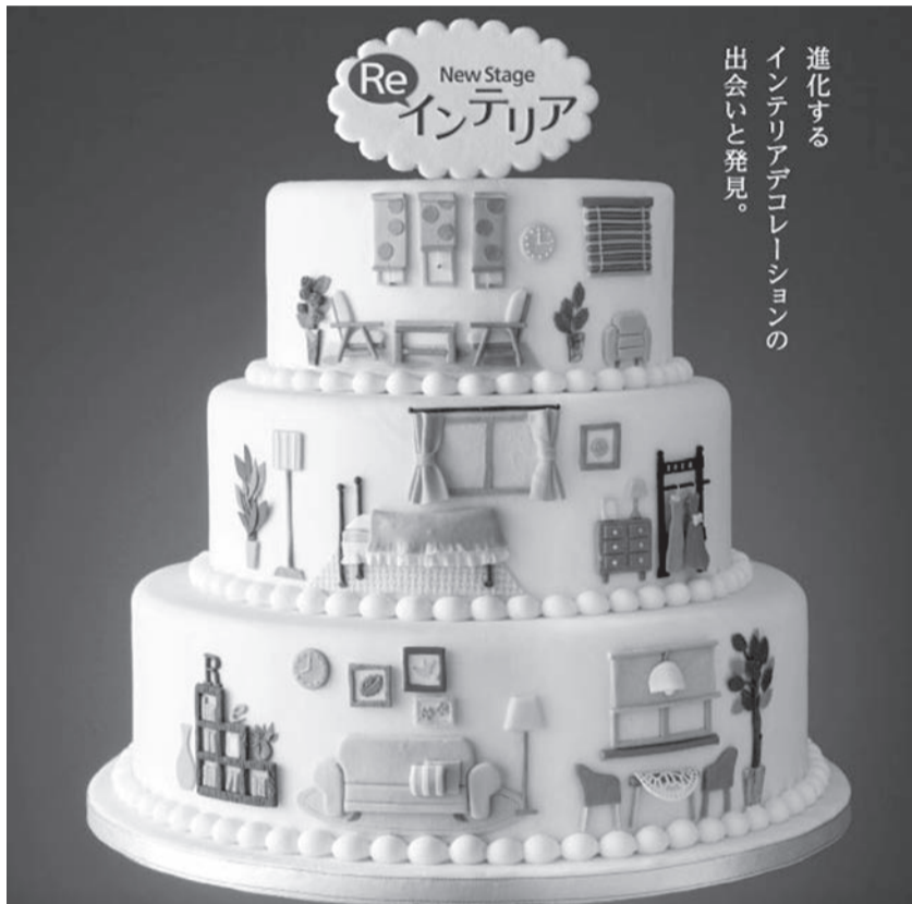
進化する インテリアデコレーションの 出会いと発見。

Web事前登録で無料入場いただけます。▶ http://japantex.jp/