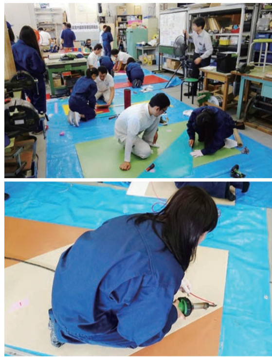
職人技を体験する女子高生たち

教育を実施した。授業を受けたのは同校産業デザイン学科2年生の女子生徒9名。授業内容はビニル床シート、パーマリュウム(田島ルーフィング)をカッティングマットとして活用し、