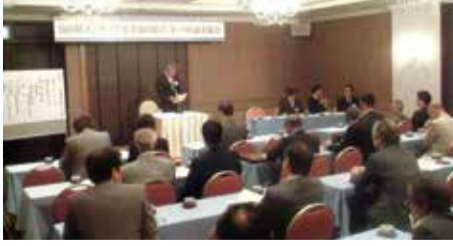
富山県技能士会連合会通常総会に小倉理事長が出席。