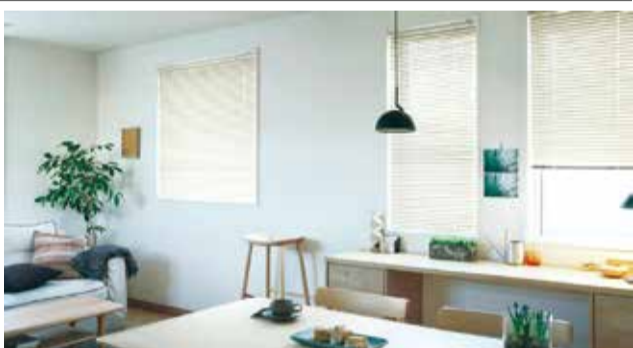
アルミブラインドシリーズ「ベネアル」

トソーは、「使いやすい」「選びやすい」「わかりやすい」にこだわった新たなアルミブラインドシリーズ「ベネアル」を新発売した。