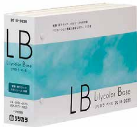
「LB リリカラベース」見本帳

この他、商品ごとにお すすめ天井とタッショ ンフロアを紹介、同見本 帳だけで空間トータルの コーディネート提案が可 能となる。 なお全100点すべて の施工例写真が同社ホ ムページにて公開されて いる。