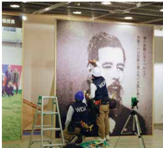
デジタルクロスの施工実演

和歌山組合、および和歌山組合青年部(WIDA青年部)は、新しいインターネット・内装ビジネスの可能性を見据えた取り組みとして、「デジタルクロス研修会」を、5月16日、和歌山ビッグアトリビウムにて開催、