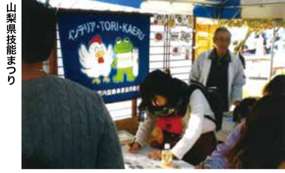
山梨県技能まつり