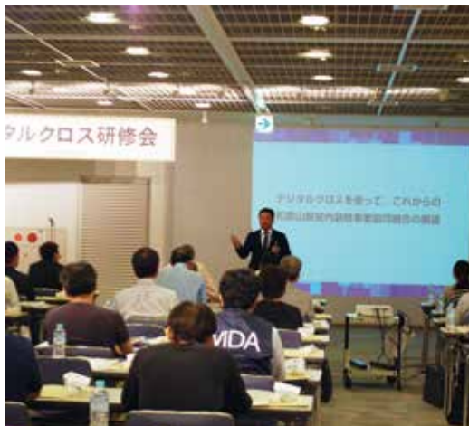
浦口副理事長による解説