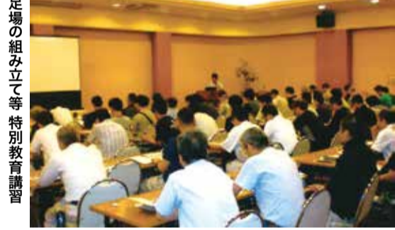
足場の組み立て等特別教育講習