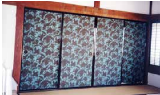
「商談の間」の襖