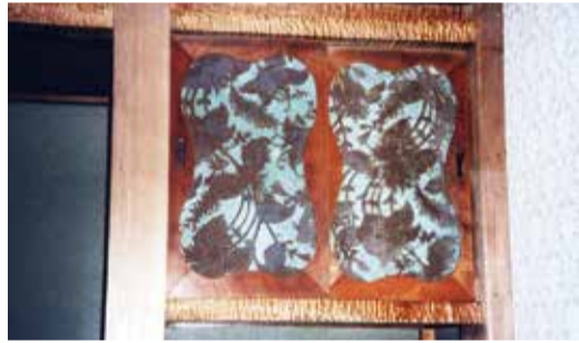
「商談の間」の袋戸棚

すべての部屋が和室で、竣工した頃は、当時貴重品であった壁紙が全面に貼られていたという。しかし残念なことに、その頃の壁紙は僅かに一階の「金庫の間」と「二階の「商談の間」の間、二階の「商談の間」の襖に残っているのみである。「金庫の間」と「商談の間」は接客に使用するため、全国各地から選りすぐられた銘木や精緻 な彫刻の欄間等を用いて贅を尽くした造りとなっている。 さて、襖に残っているのは間違いなく金唐草紙（きんからかわかみ）であった。3部屋とも同柄同色で、トルコ石を連想させる青地に金色の洋風蔓花文様が浮き出ている。筆者は、全国各地の金唐草紙を見ていたが初めて見る柄である。金唐草紙にもいくつもの種類があるが、中には輝かせるための必要要素である錫箔を貼っていない単なるエンボスだけのものもある。また、錫箔をワニスで金色に輝かせた本格的な金唐草紙であっても、ほとんどが長い年月の間に黒酸化して輝きを失っている。その点、花田家番屋の金唐草紙は、色も驚くほど鮮やかで錫箔部分もくろくろくして輝いている。ぜひ、一人でも多くの人の目に届きたい。