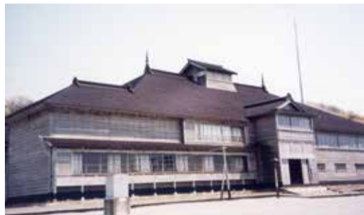
旧花田家番屋の全景

ここ数回、インテリア市場分析などお堅いテーマが続いてしまった。そこで今回はリラックスする意味で北海道留萌郡小平町鬼鹿（おにしか）にある国指定重要文化財として最北端に位置する花田家番屋を紹介したい。 周知のように北海道もインバウンド需要の外国人客で溢れかえっている。特に雪を見る機会が少ない台湾や東南アジアの人たちにとっては、大雪山の雄大な景色は涙が出るくらいに感動もの