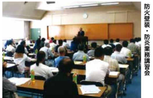
防火壁装・防災業務講習会

さまざまな施策が行われているが、直近の統計によると総人口数は82万人弱。空き家率20.3%は、全国平均13.1%を7ポイント以上も上回っており、人口1人当たりでは、全国でも一番多い結果となっているのが現状であるという。しかし他方で、二地域居住や別荘族、Uターン、Iターンでやって来た若い世代にとって山梨県は、昭和の人情や近所づきあいなど、東京都に隣接しながら、大都市にない、いいところがたくさん残る街として映るようだ。