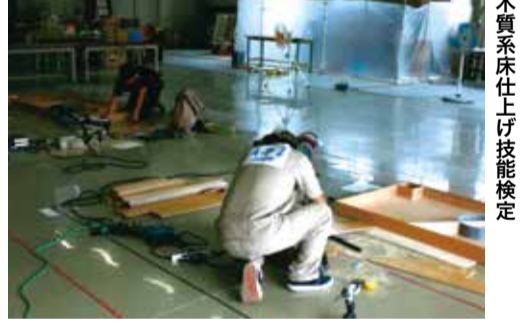
木質系床仕上げ技能検定