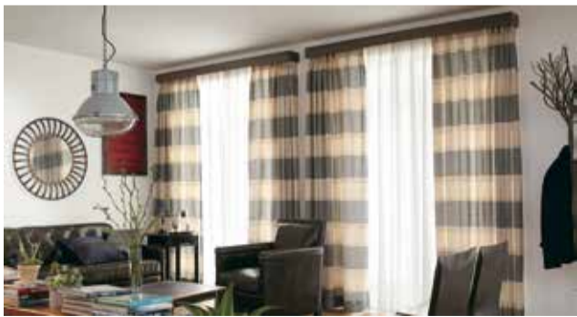
「ノイボックス」の施工イメージ

操作性については、コ ードを引くだけでフライ ンドが上ががり、コードを 少し引いて手をゆるめると フラインドが下がると