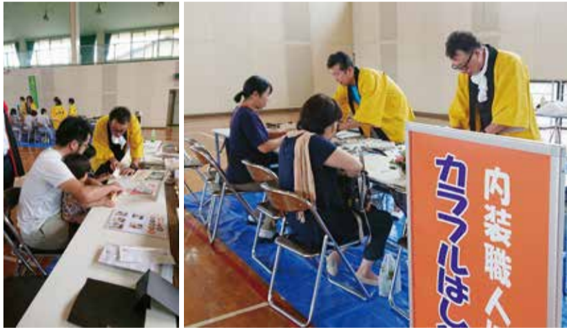
熊本組合5日 熊本県技能士会連合会地域技能フェア

10日 プラスチック系 床仕上げ工事作業検定準 備講習会を開催。1級2 名、2級1名が受講。 22日 平成29年度ラ