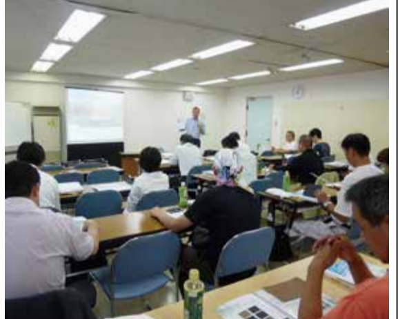
デジタルプリントセミナーの様子