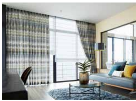
トータルインテリア提案を強化

(ハノカ)が追加される。これは、日本人が古くから生活の中で大切にしていた四季や自然を取り入れた、今人気のモダンインテリアを日本の暮らしに合ったスタイルで提案するもの。日本の花鳥風月から得たデザインソースをモダンにアレンジしたアイテムや、織物文化館にストックしている膨大な資料の中から選りすぐった文様、あるいは帯や緞帳などの事業で触れてきた古典文様を現代のセンスでよみがえらせるなど、同社ならではのこだわりでインテリアフアブリックに仕上げた。また「filio」で人気のウィリアム・モリスシリーズ「モリスデザインスタジオ」にも新作を投入、さらに同社トップデザイナーの本田純子氏が企画・デザインする「Sumiko Honda」は、今年6月に新発売された桜をモチーフにした「チェルカール」といった新作をはじめ全点を掲載する。この他、今回の「filio」ではトータルインテリア提案に注力、見本帳やスタイルブックにおいてテキストミックスのデザインテイストを多様に展開、さらにそのトータルインテリア提案を具現化させるために、「filio」との組み合わせを念頭に開発したラグジュアリーなラグシリーズ「ラグコレクションV OL・4」も同時に発売する。