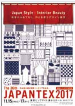
今年度は創立五十周年記念式典実施のため小規模での出展となる。

「第36回 JAPANTEX 2017」(主催・EX2017)(主権・日本インテリアアソシエーション)が、来る11月15日(水)～17日(金)の3日間、東京ビッグサイトにて開催される。 開催テーマは「Japan Style X Interior Beauty」(日本のおもてなし、ひとを想うデザイン美学)。日本の様式美「室礼」をデザイン・素材・コーディネートを通じて表現 また「デジタルリビングエリア」、例年好評のセミナー・トークショーは、ビジネス、デザインなど幅広いテーマの全20講座を行う。 なお日装連ブースはJ T4-20。 今年度は創立五十周年記念式典実施のため小規模での出展となる。