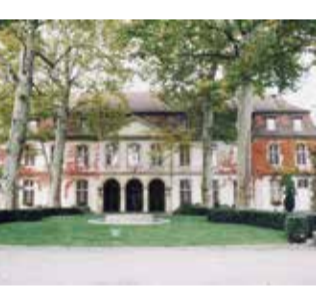
220年続く世界最古の壁紙企業ズベール社