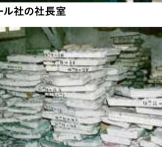
所狭しと積まれたパノラマ壁紙用の木版