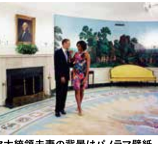
オバマ大統領夫妻の背景はパノラマ壁紙