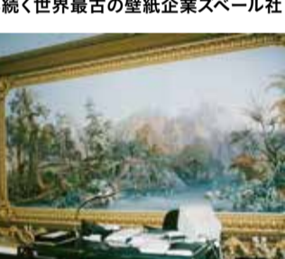
ズベール社の社長室