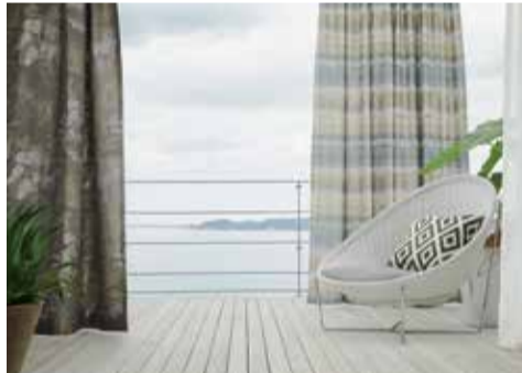
新カテゴリー「hanoka」追加

川島織物セルコンは、最上級のインテリアフアブリックシリーズ「filio」(フィロ)を10月2日に新発売する。「filio」は、日本から製造までの一貫体制を保有する同社が、もっともこだわった最上級の