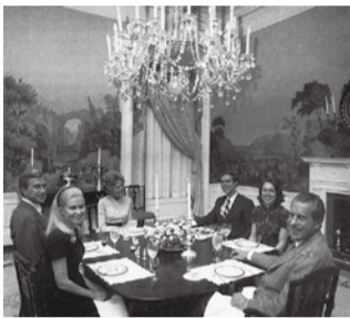
オバマ大統領一家とパノ マ壁紙