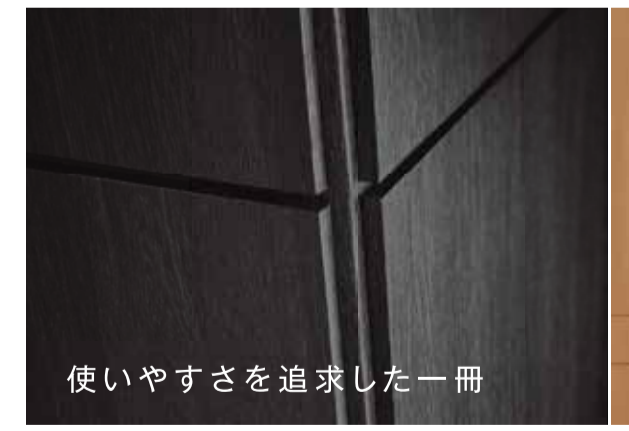
使いやすさを追求した一冊

「新しいことに取り組む」をキーワードに、将来を見据えた施策を果敢に実行していく神奈川組合。組合運営のベースである防災・防火壁紙ラベルの発給事業について、今から8年前に大きな改革を実行した。ラベル会員制度の廃止だ。